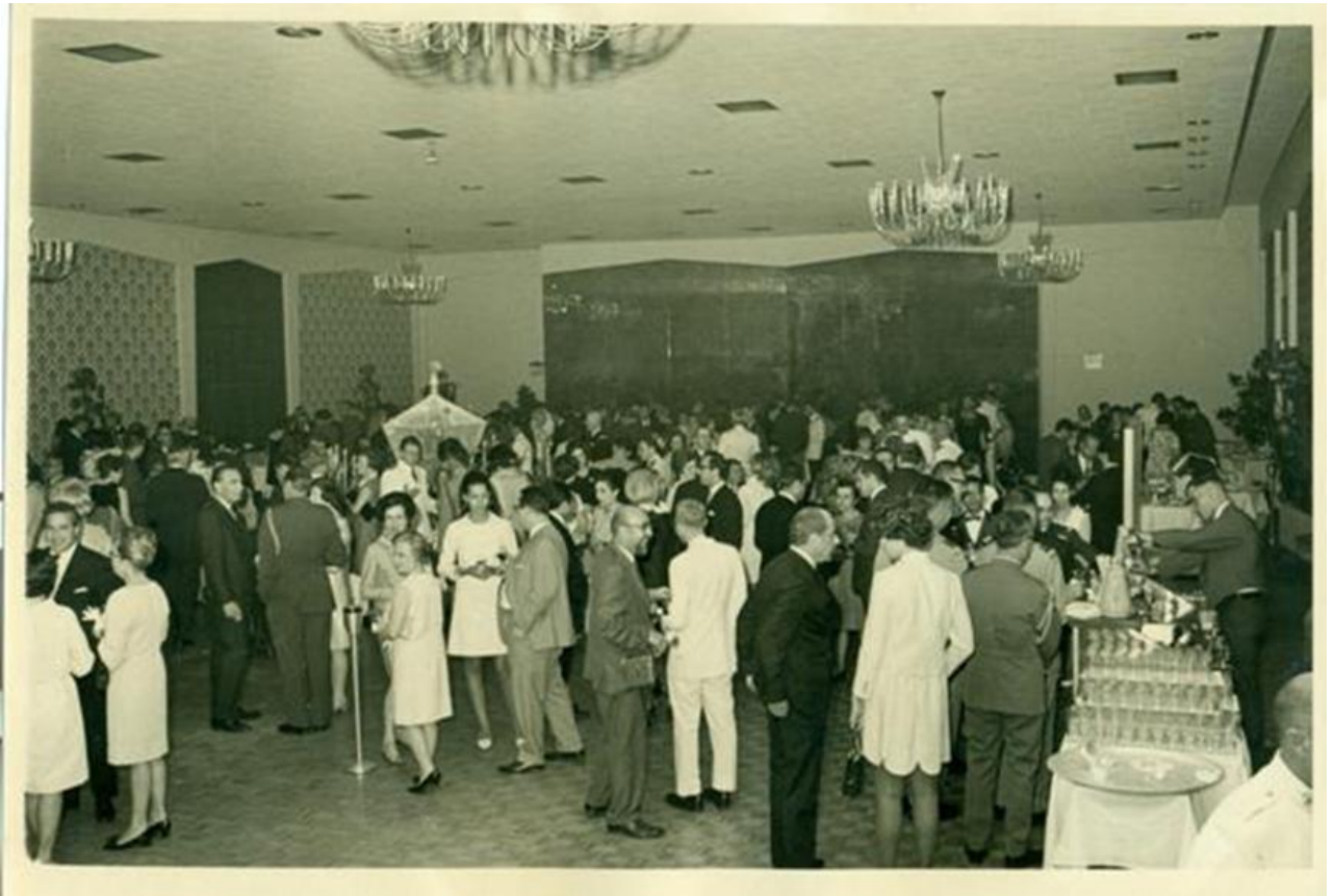
Forth Myers Officers « CLUB » - Washington D.C. -- USA